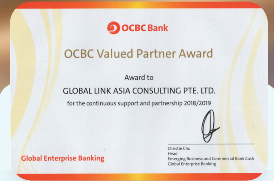
Đối tác tin cậy của ngân hàng quốc tế OCBC Bank