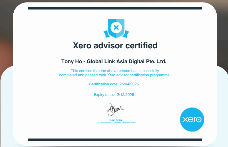
Chứng nhận hoàn thành bài thi từ XERO hằng năm