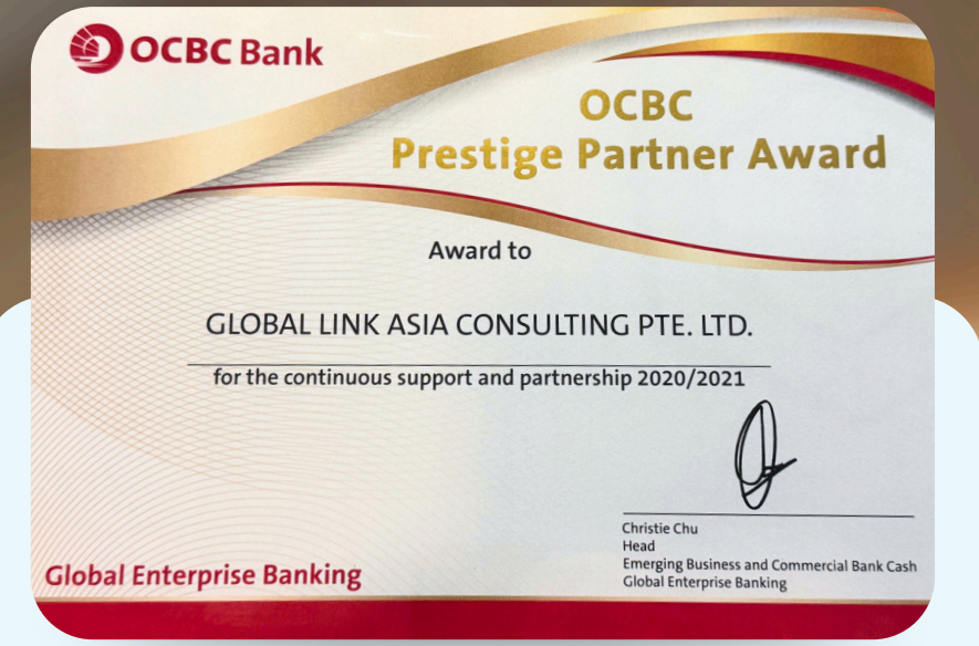
Đối tác tin cậy của ngân hàng quốc tế OCBC Bank