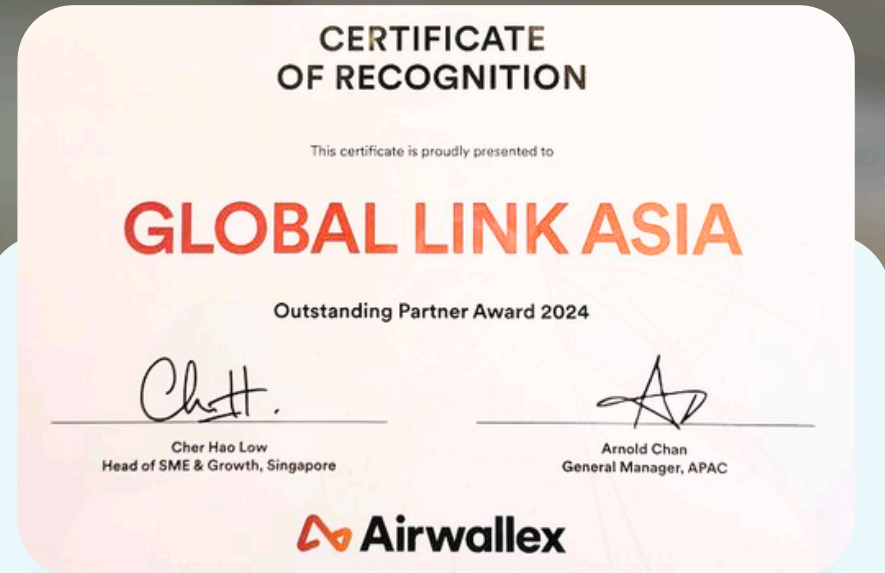
Đối tác tin cậy của ngân hàng quốc tế Airwallex