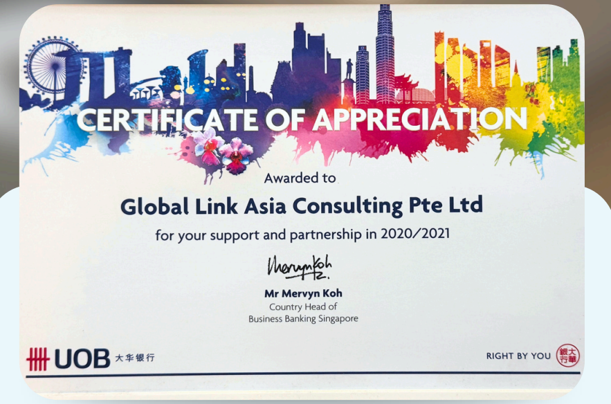
Đối tác tin cậy của ngân hàng quốc tế UOB Bank