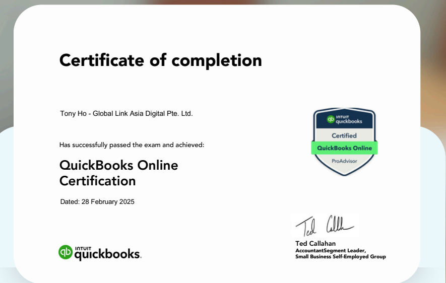
Chứng nhận hoàn thành bài thi từ QuickBooks Online hằng năm